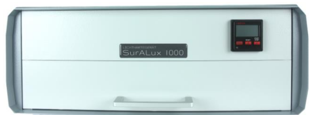
SurALux 1000 - Lieferumfang

zum Versand. Nutzen Sie die hervorragenden Eigenschaften von SurALux 1000 , um Ihren Doming-Etiketten, 3D-Aufklebern oder anderen Werbeartikeln, in jeder Form oder Farbe, eine höhere Qualität, einen visuellen Wert und das zusätzliche Gefühl von Luxus zu geben.